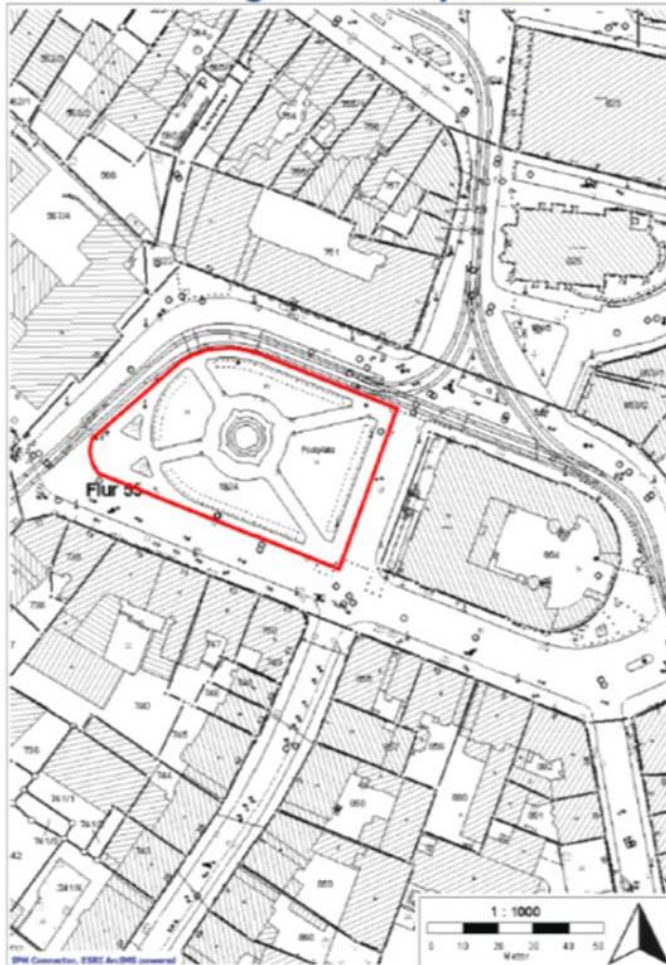
Anlage 4 - Postplatz