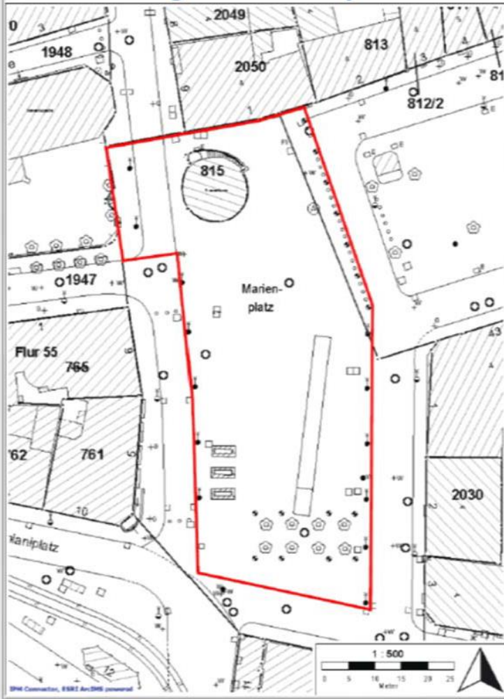
Anlage 1 - Marienplatz