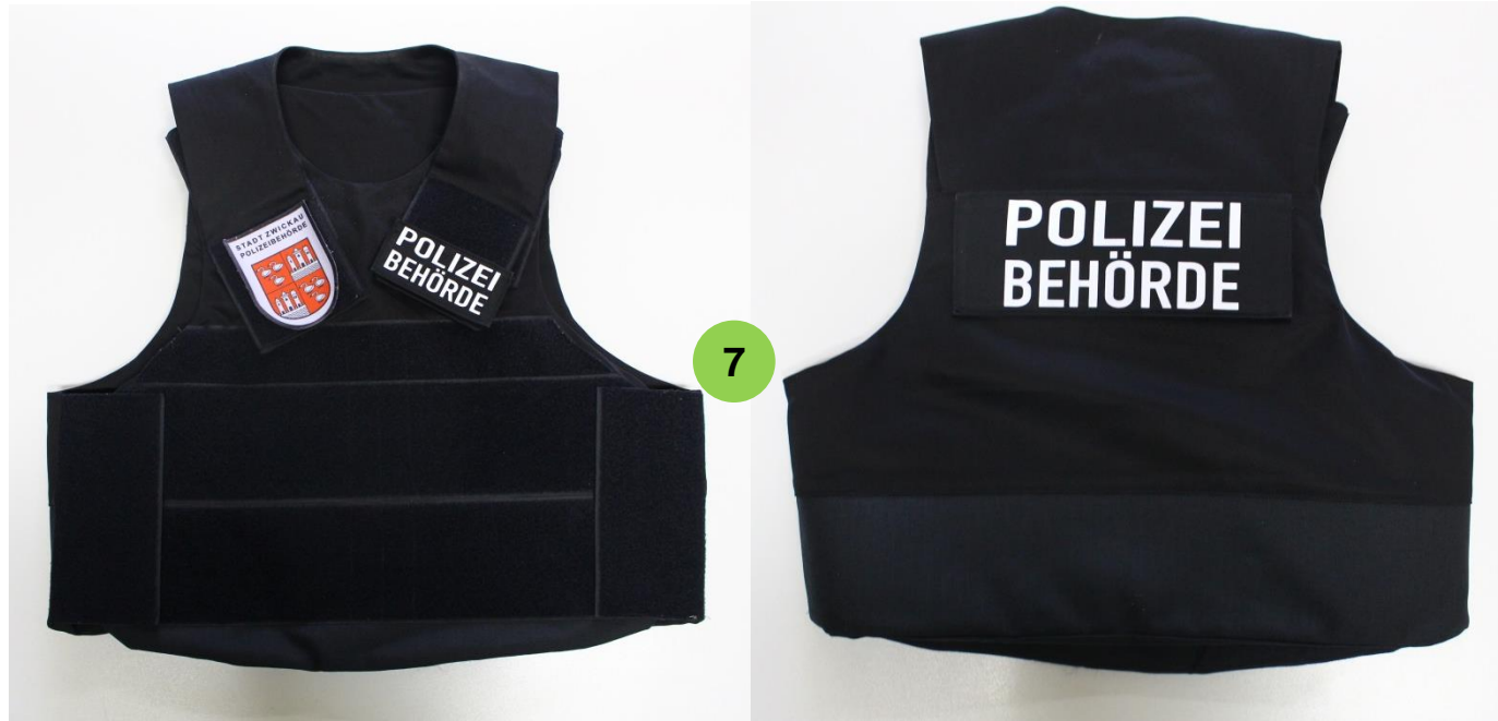
7 Schutzweste, ballistischer Schutz und Stichschutz, taktische Hülle