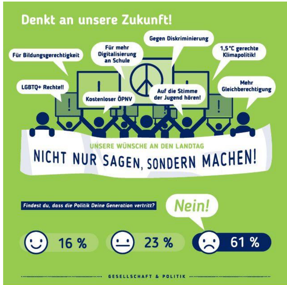
Jugendbefragung 2.2 (Jugendrat des Kinderschutzbundes SH)